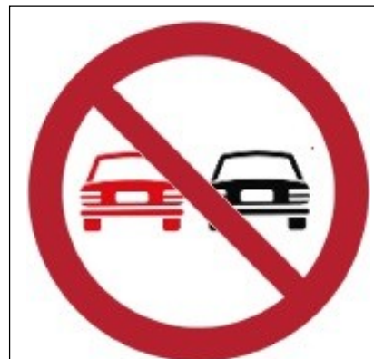
Divieto di sorpasso