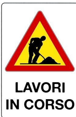
Lavori in corso